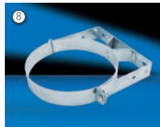
Wandbefestigung WB50, WBV